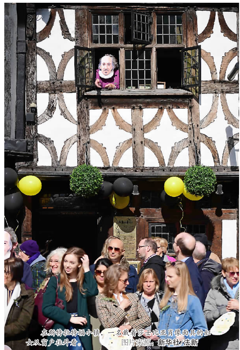
在斯特拉特福小镇，一名戴着莎士比亚肖像面具的妇女从窗户外看。

旅游交流的背后便是文化的互鉴与欣赏。作为同一时代的两位伟大戏剧家，其殊途同归的艺术魅力星光闪耀。4个世纪后，“故乡的邂逅”再次拉近两个民族的情感纽带，用文化旅游参与并见证中英关系的“黄金时代”。