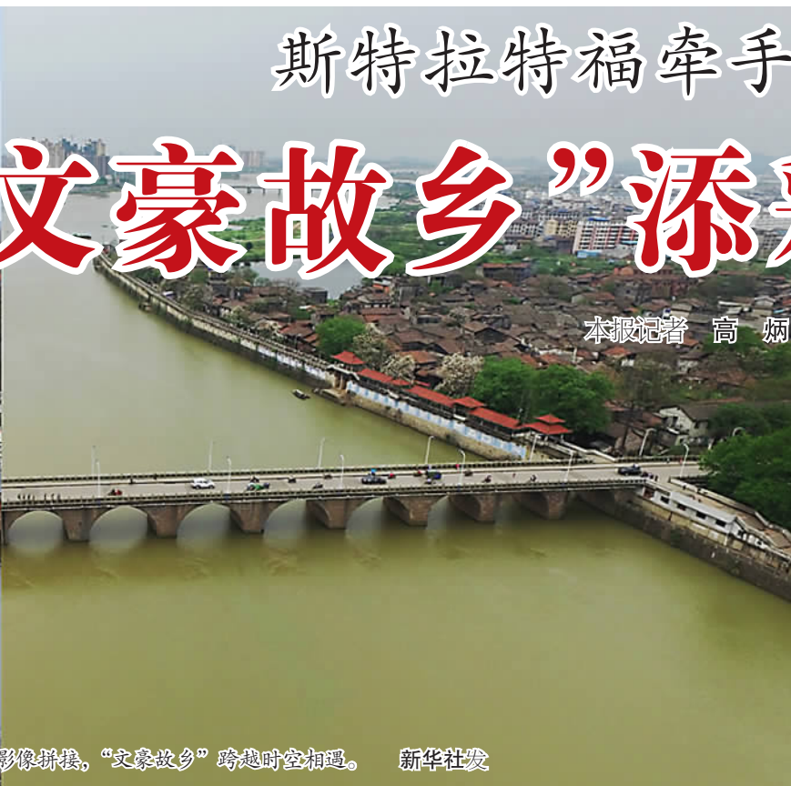
本报记者 高 炳