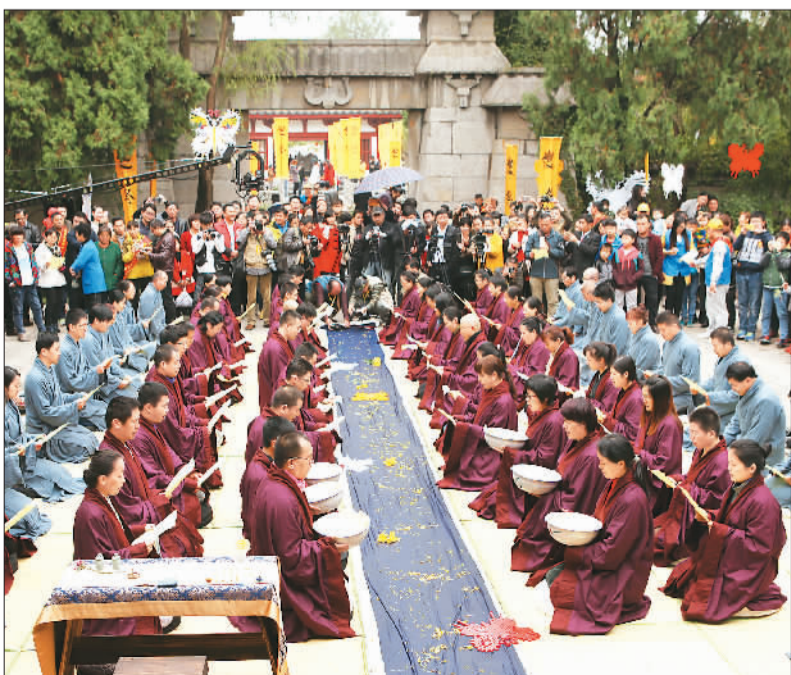
10月23日，安徽省蒙城县举行秋季布衣祭祀庄子大典，来自国内外的100多位庄子研究专家、学者和《庄子》爱好者以及各界人士齐聚庄子祠参加活动。图为与会者齐声吟诵《庄子·马蹄》选段。