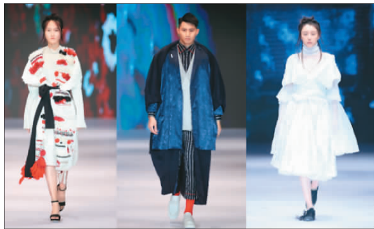
图为香港设计师的作品

“双百双赛”即“中国国际面料设计大赛（柯桥赛区）”和“Fabrics China 新锐设计师时尚创意设计邀请赛”，作为压轴之作精彩呈现了柯桥优秀面料企业和入围设计师的“天作之合”。6位入围的新锐设计师用20余家柯桥纺织企业提供的面料设计制作成衣，实现了创意设计与面料开发的最佳组合。