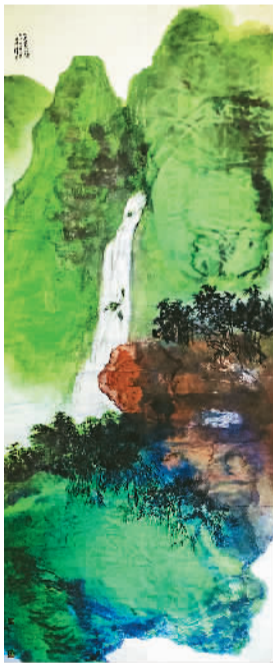
山高水长 陈佩秋、照诚

本次展览展出的《山高水长》《绿原可居》《叠嶂积翠》《霞色春风》《赤壁怀古》《山涛》等大幅巨制，不仅呈现了两位大师高超的艺术造诣，更传递出他们潜心中国传统文化的深邃意韵。字里行间，凝练着传统文化的深厚力量，跃动着他们的执著与炽热。