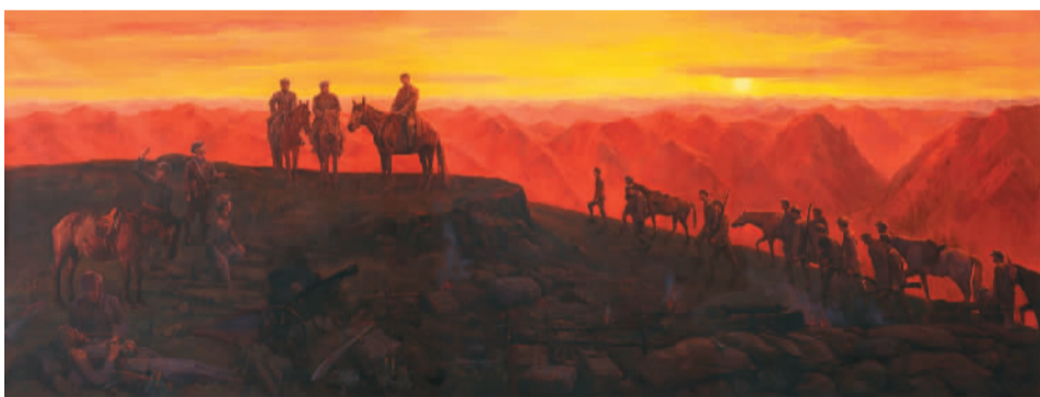
娄山关大捷 郑艺、宋克、周楷、关君 清华大学美术学院

此次大规模的主题性美术创作，是深入贯彻落实习近平总书记系列讲话精神，特别是文艺工作座谈会上的重要讲话精神，繁荣和发展社会主义文艺，增强民族文化自信，催生主旋律美术精品创作的一项重要举措。几乎每一组创作团队都试图通过重走长征路，追寻长征遗存、考证史料、现场写生、搜集素材等行动，去身临其境地体悟长征精神，大量手稿、影像、文字，记录了他们克服困难、全情投入、精心打磨、潜心创作的历程。这本身就是当代艺术家传承长征精神的体现。