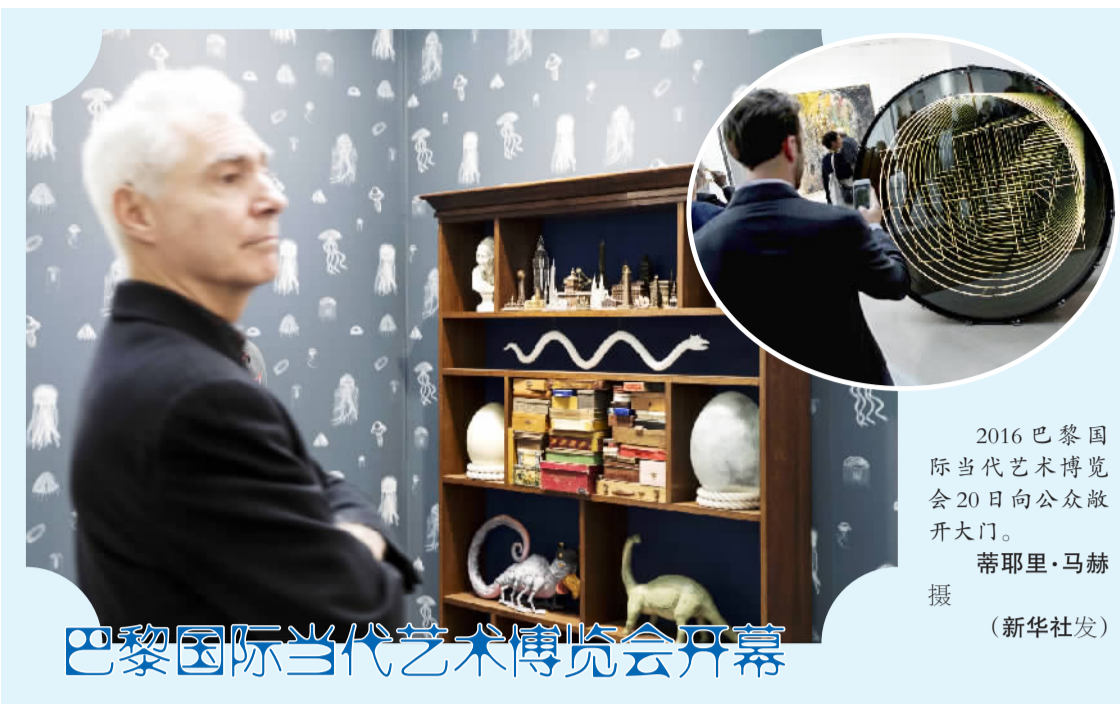
2016巴黎国际当代艺术博览会20日向公众敞开大门。

当地警方最初说,船上共有约180名乘客,但一些获救者称,渡船航行沿途还有其他乘客上船,倾覆时船上大约有300人。实皆省议会议员吴春吞温说,事故原因为渡船超载。