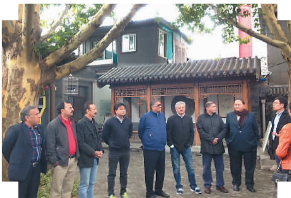
图为代表团参观史家胡同博物馆。

“中国是一个有悠久历史传统的国家，有悠久的、灿烂的文明，在这样的环境中生活的人民有着一个整体的历史观，很让人钦佩。”苏海勒·萨瓦尔·苏丹表示，“我们回去后将把对中国、对北京的美好印象传递出去，向人们介绍中国和发展情况以及中国对巴基斯坦的帮助，增进中巴两国的人文交流。”