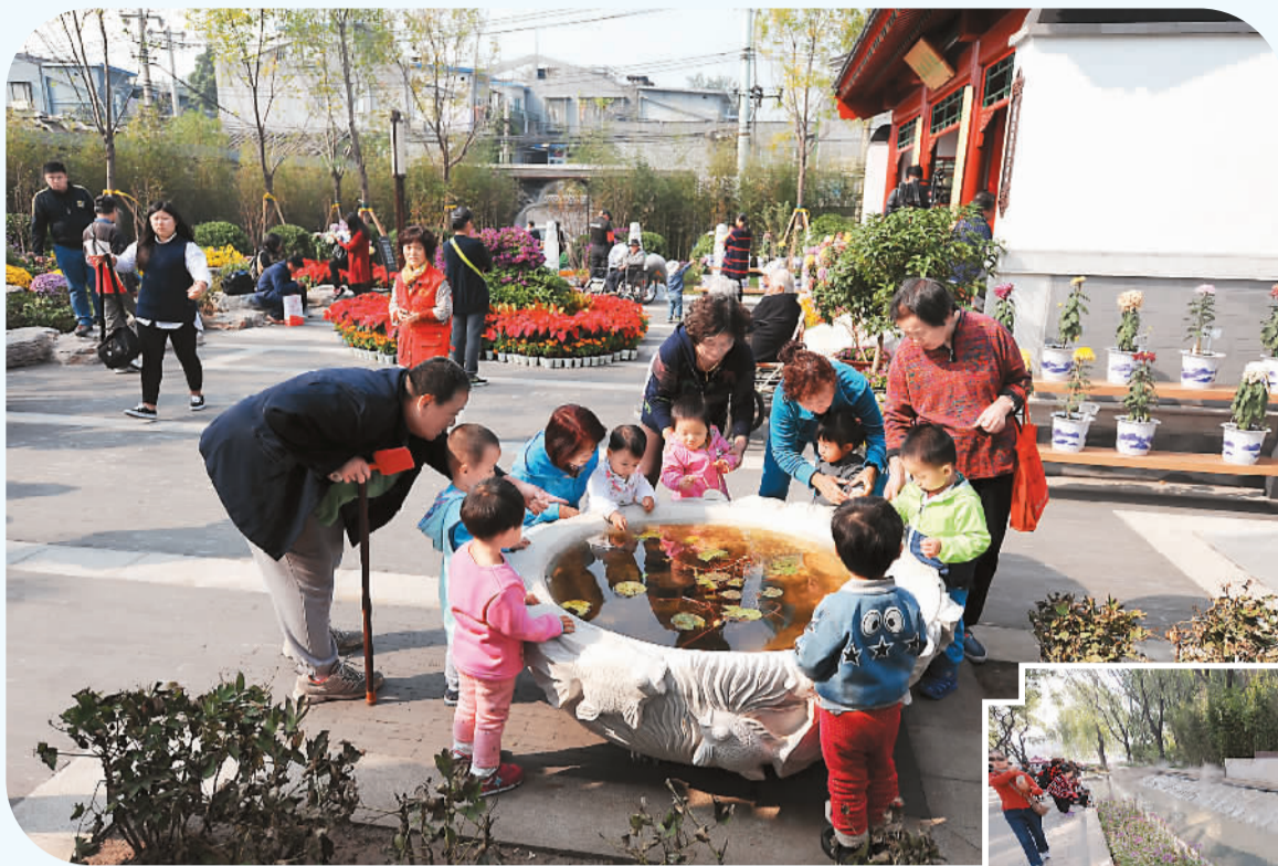
大图为老人和小孩在大栅栏百花园休息玩耍。