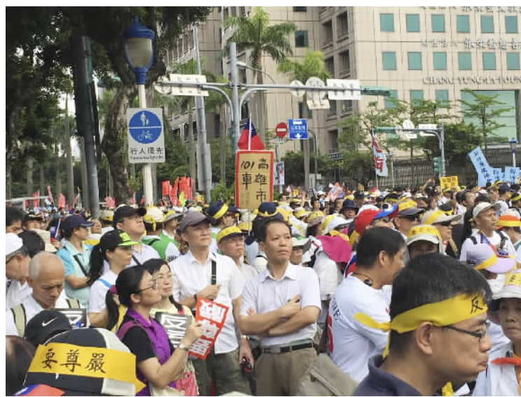
9月3日的军公教大游行现场。