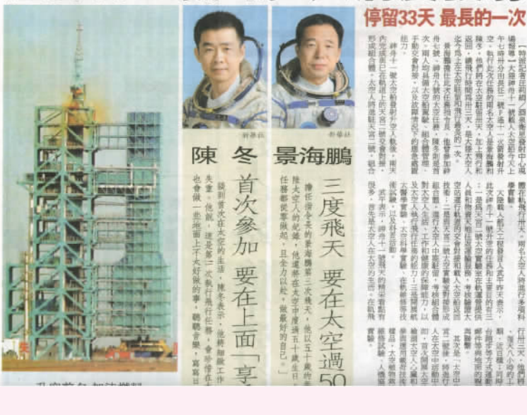
停留33天 最長的一次