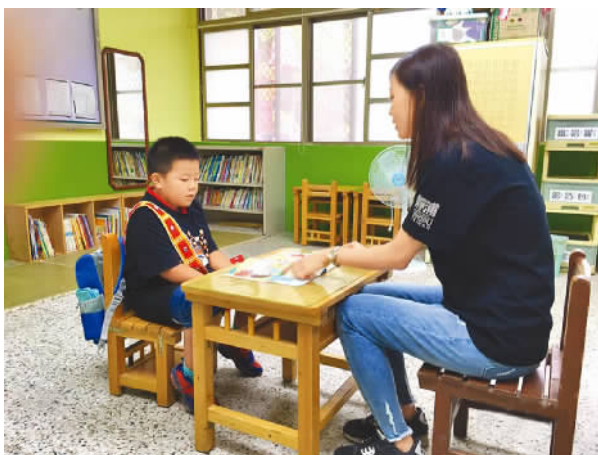
花莲县丰滨乡静浦小学仅有1人入学。图为老师与唯一的一年级新生上课。

只不过,年金破产的问题已经火烧眉毛,并不是装着不见就不存在。台湾年金制度何去何从?整个台湾社会都在拭目以待。