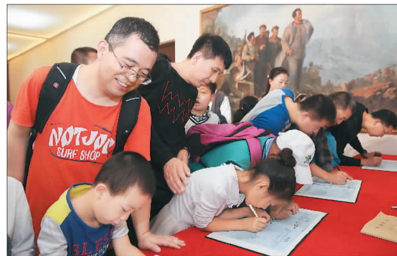
图为参观者在留言台书写观后感。

说:“今年我与家人到四川追寻了一段长征路,看到大渡河湍急的河水,不禁联想到当年红军战士的艰辛,被红军战士的精神所折服。作为党员,要向红军学习,心中有信仰,不忘初心,继续前行!”