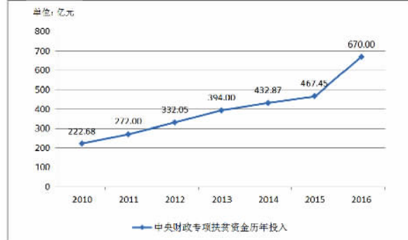
中央财政专项扶贫资金历年投入情况(2010—2016年)