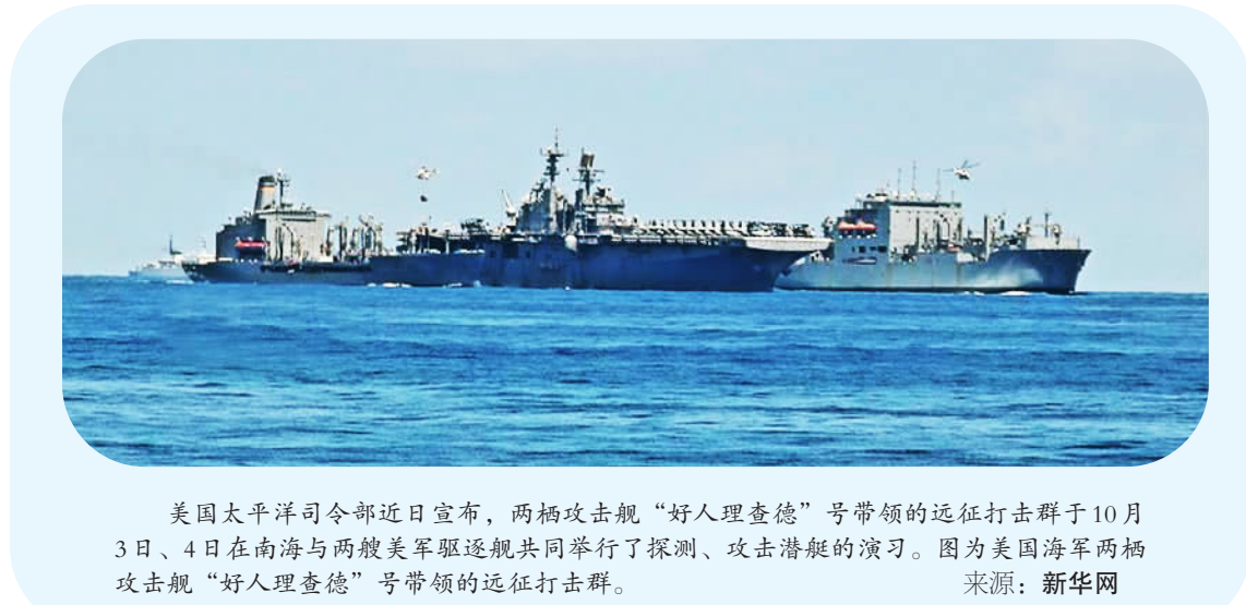
美国太平洋司令部近日宣布，两栖攻击舰“好人理查德”号带领的远征打击群于10月3日、4日在南海与两艘美军驱逐舰共同举行了探测、攻击潜艇的演习。图为美国海军两栖攻击舰“好人理查德”号带领的远征打击群。