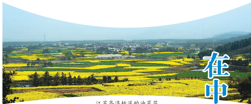
江苏高淳桤溪的油菜花

让生活慢下来，让心灵静下来，品味生活中的点滴美好。“慢生活”就像一坛陈年老酒，历经时间的洗礼，才能如此香烈甘醇。