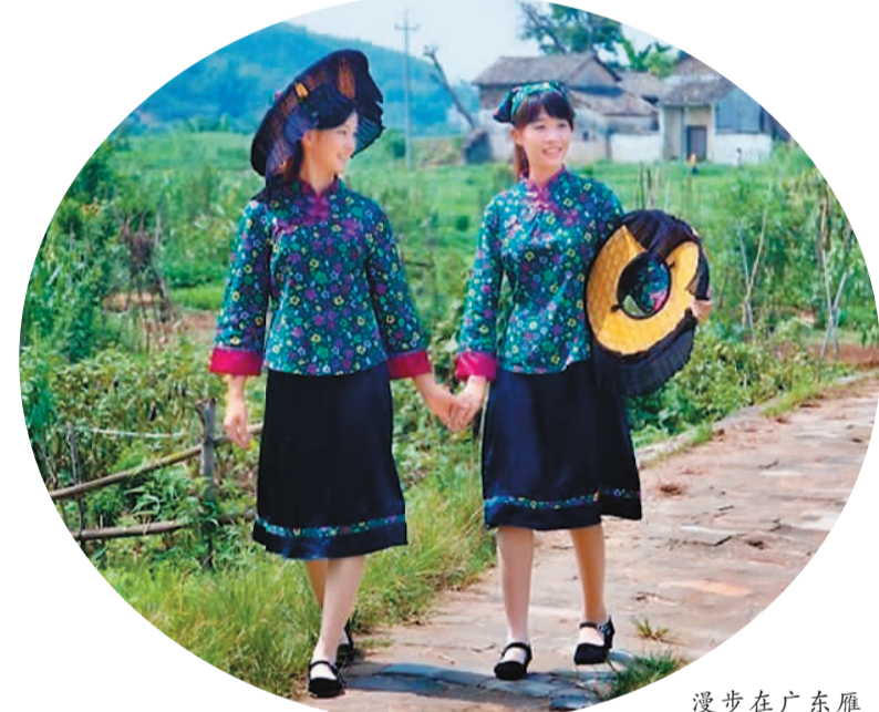
漫步在广东雁洋的客家女孩