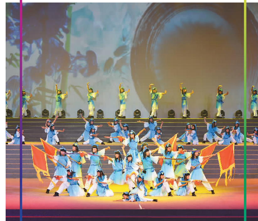
10月10日,为期4天的第九届中国·沧州国际武术节在河北省沧州市体育馆开幕。共有来自韩国、德国和中国等33个国家和地区的1000多名运动员参赛。图为演员在开幕式上表演。