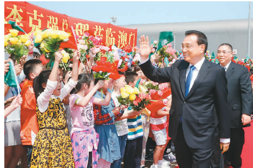
10月10日,中共中央政治局常委、国务院总理李克强乘专机抵达澳门特别行政区视察,并出席中国—葡语国家经贸合作论坛第五届部长级会议开幕式。