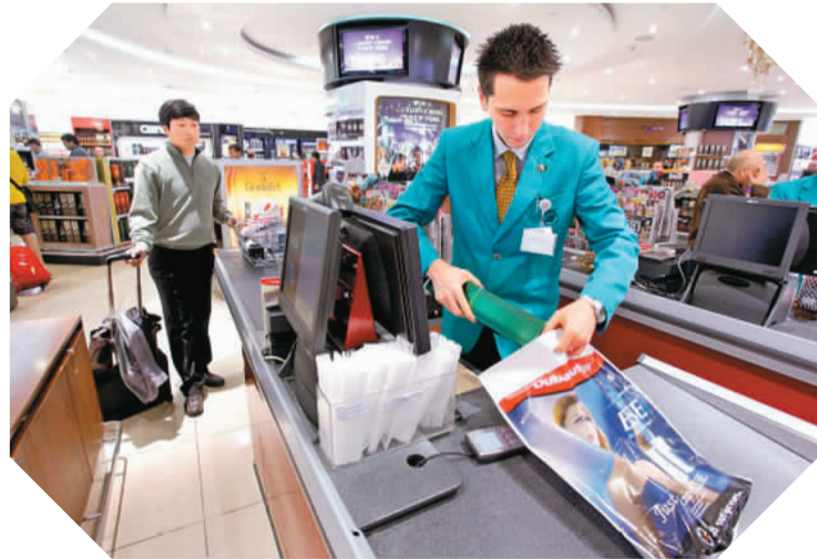
中国游客在国外消费

联合国世界旅游组织数据显示，自2012年起，中国连续多年成为世界第一大出境旅游消费国，对全球旅游收入的贡献年均超过13%。2015年，中国出境游人次和花费继续位列世界第一，比前一年增加25%。自2008年世界金融危机以来，中国出