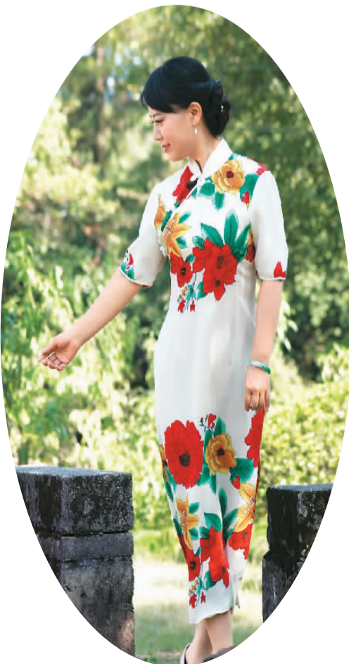
(本版图片除署名外均为资料图片)