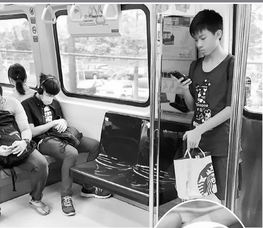
▲台湾大众运输工具上，有一些深蓝色座位，它们就是“博爱座”。座位旁边会写“请优先让位给需要的乘客”，或写“请优先让位给老人、孕妇、行动不便及抱小孩的乘客”，并配以相关的图案。图为台北捷运上的博爱座，经常空着也没人敢坐。（资料图片）

多年前，笔者第一次看到厉老师的诗集也是惊诧不已。他写的并非现代诗，而是古体诗词。从少年时代即写起，亲情、爱情、友情、工作、生活、休闲，幸福与坎坷，忧国忧民的情怀，一流露在诗词的字里行间。感慨之余，征得厉老师同意，以他的诗词为主线，穿插其传奇经历、学术成果等，于2003年写作并由经济科学出版社出版了《厉以宁的诗意人生》一书。书分为四个章节：两个故乡：江苏仪征和湖南沅陵；两个学习领域：经济学和诗词；两个北大：浮面上的和深层次的；两种深情：家为国。