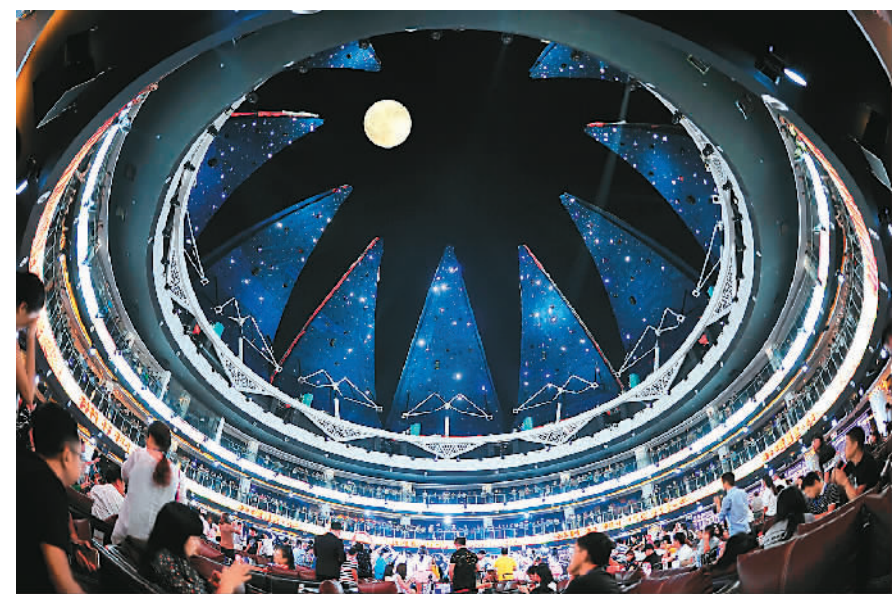
4000多名中外游客在9月份建成营业的世界最大旅游文化吧过中秋

2013年起，张家界市开始实施“提质张家界打造升级版”战略和“1656”行动计划，确定了“三星拱月、全域旅游”发展思路，对武陵源核心景区这个“月亮”重点提质，对东线、西线、南线旅游“三星”，进行提质升级和开发建设，打造推出12条户外精品旅游线路，升级扩容了旅游休闲度假产品。