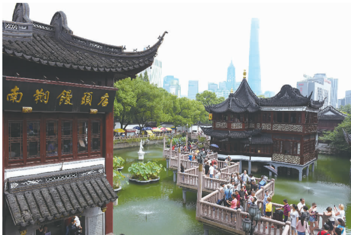
上海豫园九曲桥