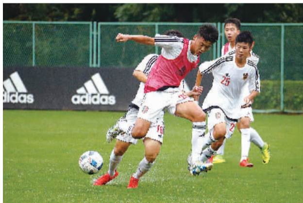
崇明徐根宝足球基地的少年球员