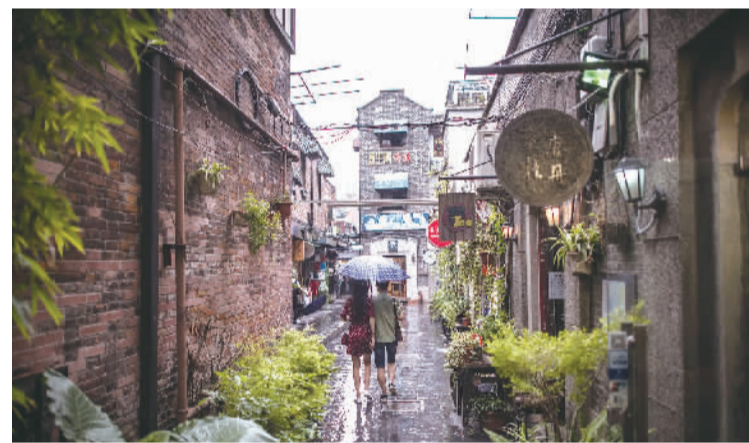
田子坊休闲时光

“世界摄影家看上海”活动由上海市人民政府新闻办公室主办，中国外文局人民画报社、新民晚报社和上海画报社承办，上海对外信息服务热线协办。这次活动也是上海市新闻办继“世界画家看上海”、“海外作家看上海”之后“海外人士看上海”系列活动的最新项目。活动结束后，摄影家们的优秀作品将被编辑成大型画册出版发行。