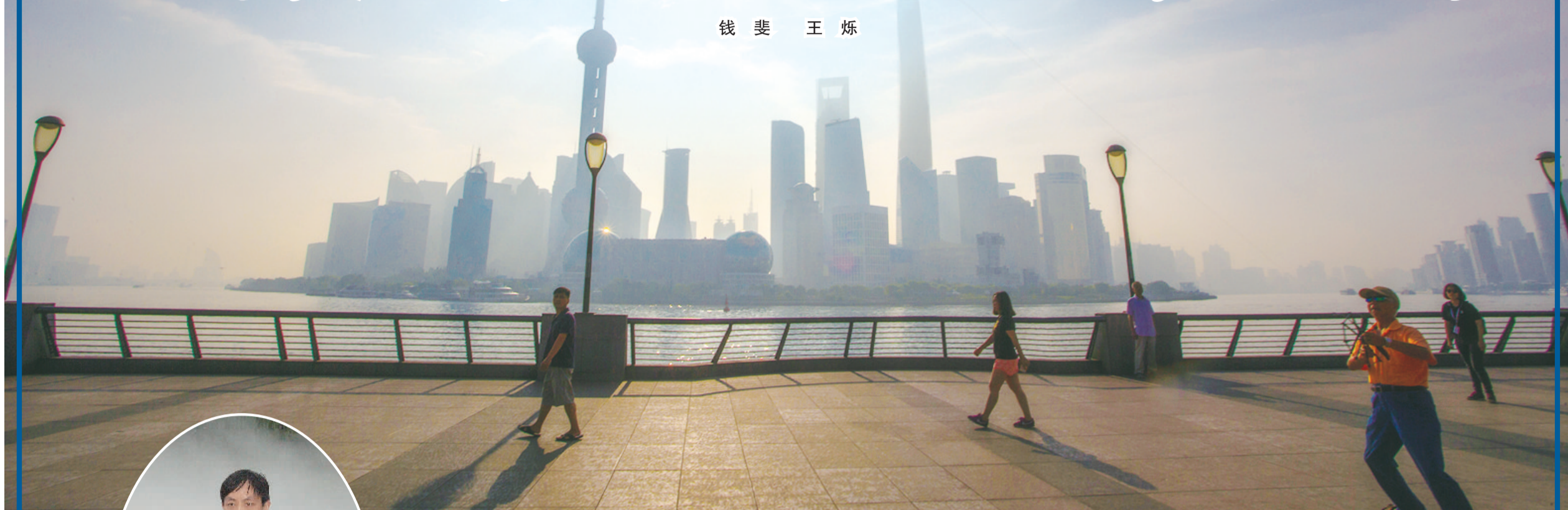
上海的早晨