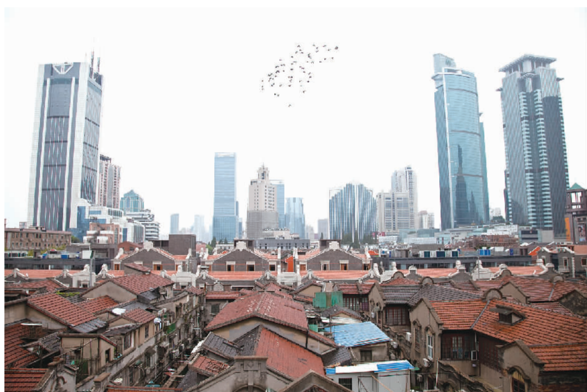
上海石库门——张园