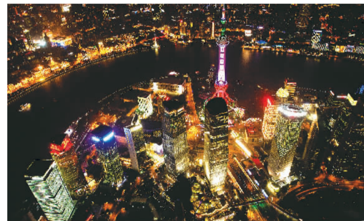
鸟瞰浦江两岸夜景