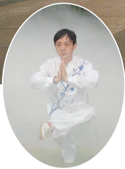
梦清园晨练者