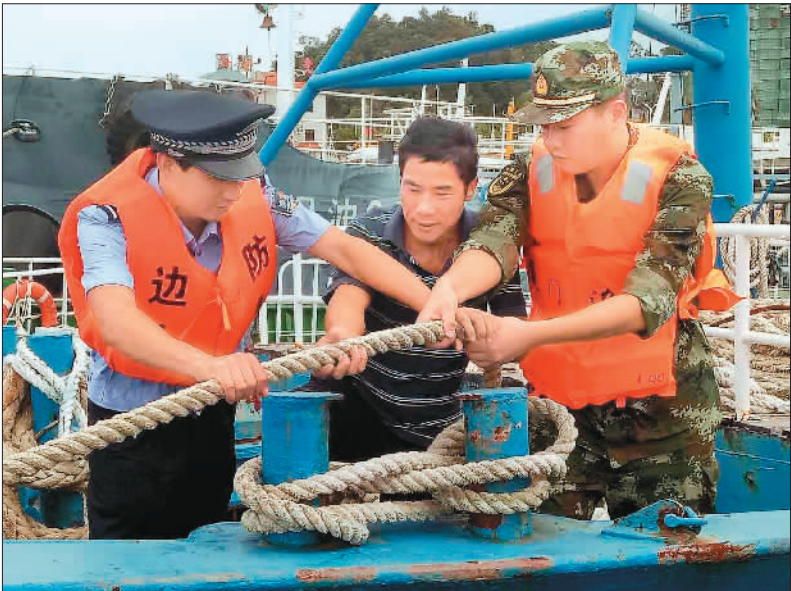
9月28日凌晨4时40分，台风“鲑鱼”在福建泉州市惠安县沿海登陆。受其影响，厦门市区及部分乡镇带来强风暴雨。图为厦门边防官兵帮助渔民将渔船转移到安全地带。