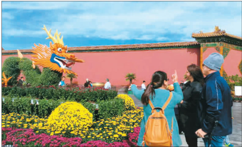
“菊香晚艳——开封菊花与故宫博物院藏菊花题材文物联展”日前在北京故宫开展，来自河南开封的3万余盆菊花和北京北海公园提供的精品菊花，分布于故宫博物院乾清门广场、隆宗门外广场、慈宁门广场等区域，旨在重现清代紫禁城菊花绽放盛况。图为观众在赏菊。