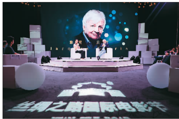
图为九月二十三日，曾执导《迁徙的鸟》《海洋》等影片的著名法国导演雅克·贝汉亮相电影节。

9月23日晚，为期5天的第三届丝绸之路国际电影节在西安闭幕。来自中国、美国、意大利、西班牙、印度等35个丝路沿线国家和地区的676部影片在电影节中参评，320部中外优秀影片集中展映。世界各国电影人齐聚古城，以电影为媒，讲述“一带一路”背景下的丝路故事。