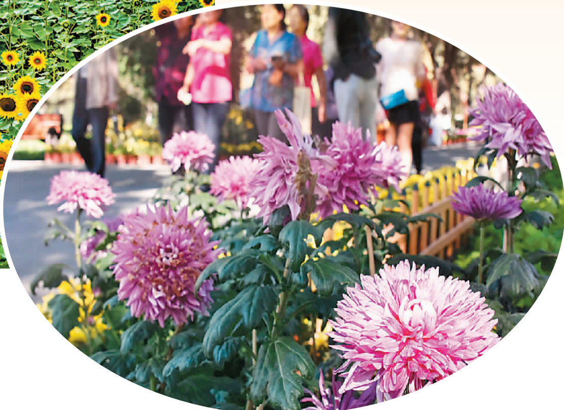
▼ 图为在新疆乌鲁木齐市植物园内，市民们观赏菊花。