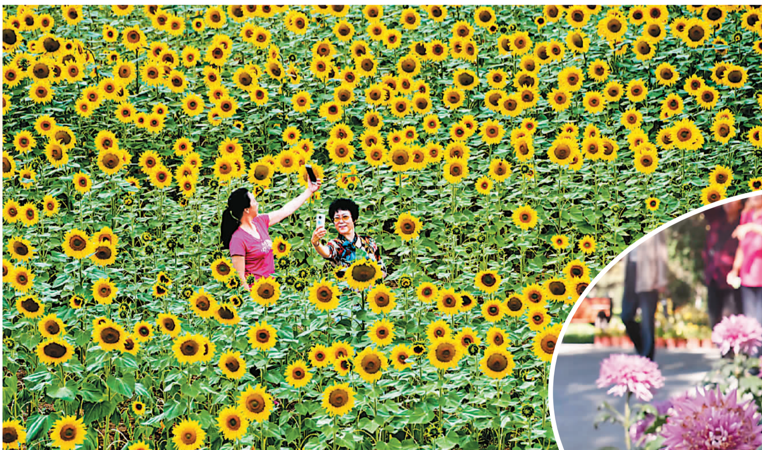
▲ 图为北京延庆四季花海，多个品种花卉竞相绽放，吸引许多京津冀的游客前来秋游、赏花。

中秋节过后，秋意渐浓。全国各地的秋日美景吸引了众多游人。大家也把秋游的照片晒在网上，与网友一起分享秋天的美丽风光。