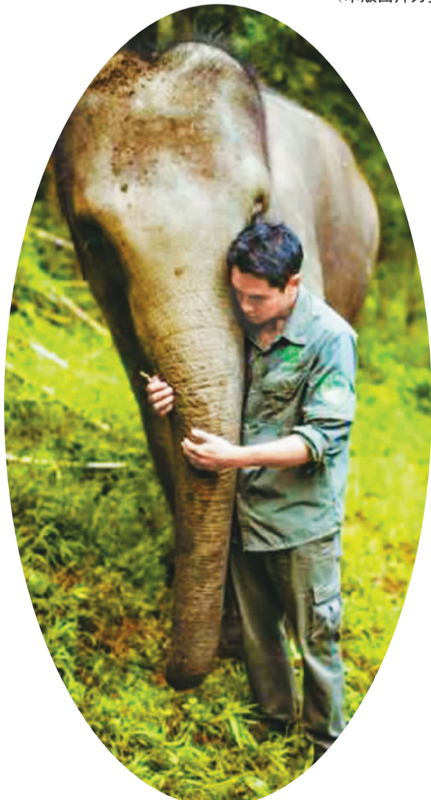
然然与亚洲象种源繁育基地的护理员