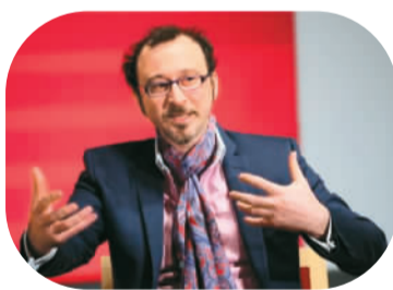
▲ 伊万·卡拉卡拉

今年7月，在黎巴嫩的巴勒贝克国际艺术节上，歌舞剧《丝路古道》首次亮相。舞台上，载着丝绸和各种货物的阿拉伯商人穿越沙漠