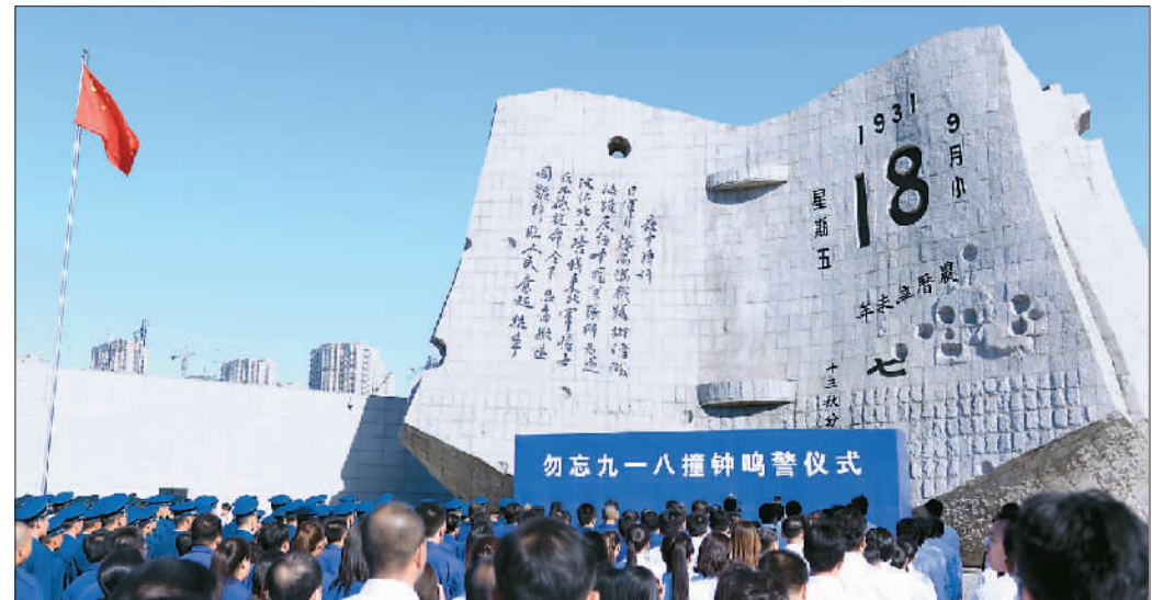
9月18日，沈阳举行“勿忘九·一八”撞钟鸣警仪式。