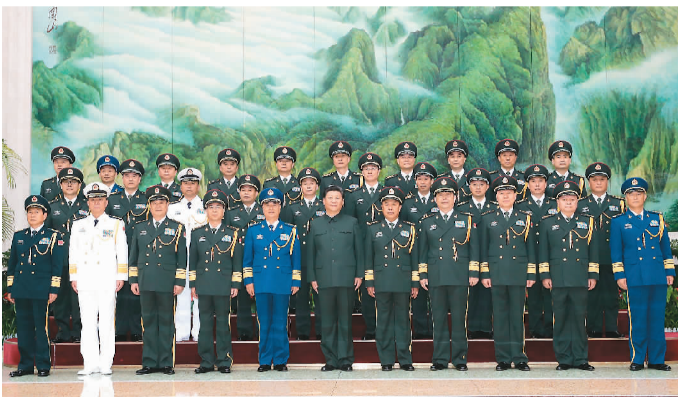
习近平接见武汉联勤保障基地领导班子成员和各联勤保障中心主要领导, 并同大家合影留念。