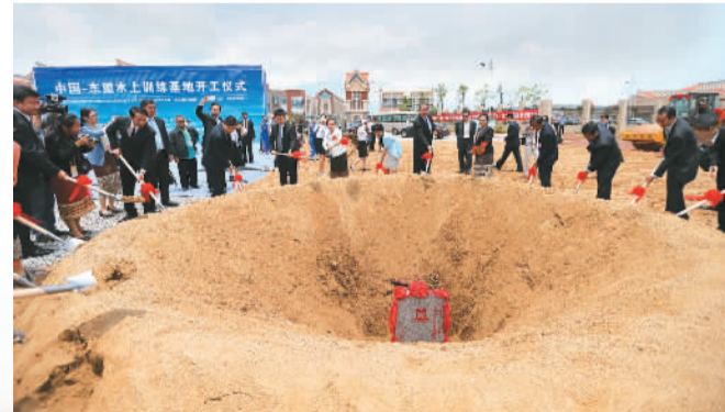
2016年5月27日，中国—东盟水上训练基地在钦州学院开工建设。

钦州市和为企业云战略合作的签订，标志着钦州市在云计算产业发展上迈入新的里程碑，使钦州能快速成为云计算及大数据产业的集中地，吸引一大批国内外知名IT企业和专业人才落户钦州，形成“钦州云谷”，推动钦州乃至广西和东盟的互联网、智慧制造、跨境电商、生物医药、新能源、新材料等高新技术产业以及港口物流、游戏动漫、文化产业、GIS导航、软件外包等服务行业的快速发展。（廖丽华、胡颖华）