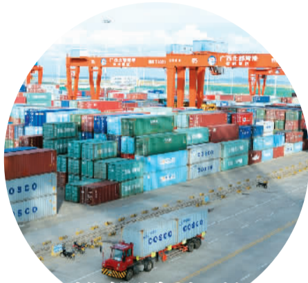
繁忙的钦州保税港区十万吨级泊位

化工、汽车、港口综合7大物流体系。中海、中远、上海新海丰和新加坡港务集团、太平船务、香港永丰等20多家船务公司、航运公司、物流企业加盟钦州港运营内外贸班轮航线业务。一个面向东盟、服务西南中南的区域性国际航运中心和集装箱枢纽港正在建成。