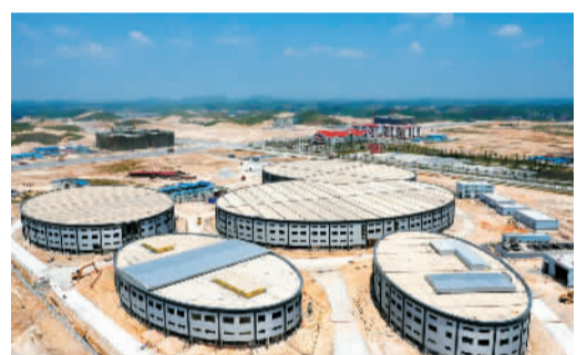
中马钦州产业园区广西慧生源医药科技有限公司

落户钦州的这些国家级开放平台均不约而同地打出了“东盟牌”——将中马钦州产业园区打造成为中马投资合作的旗舰项目及中国—东盟经贸合作、21世纪“海上丝绸之路”的先行示范园区；将钦州保税港区及整车进口口岸打造成为面向东盟的区域性物流中心、出口加工基地；钦州港经济技术开发区打造成为以石化、装备制造、造纸等大型临港产业为重点的北部湾先进制造业基地；将