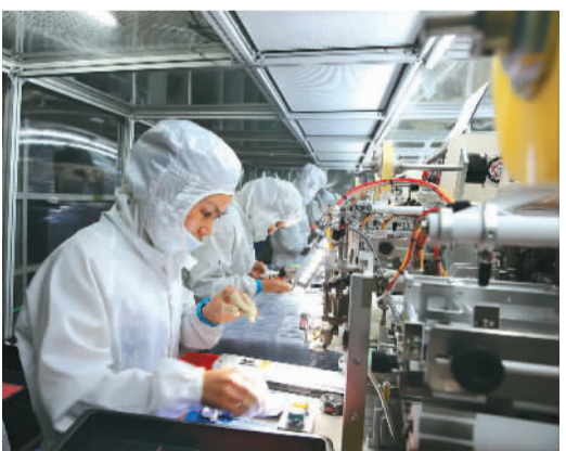
钦州高新产业蓬勃发展

“钦州平台”赋予钦州一系列国家优惠政策，这些政策聚集在钦州，成为吸引资金、技术、信息流的巨大“磁场”。