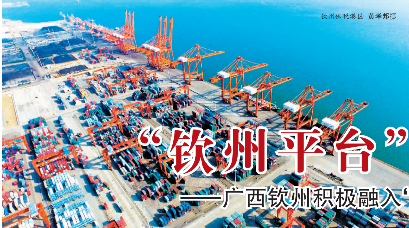
钦州保税港区