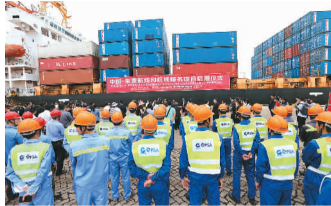
钦州港开通直达马来西亚关丹港航线。

城市框架进一步拉大，港产城融合全面加快，主城区“一环六横六纵七通道”主干路网框架形成，形成滨海新城、主城区、钦州港区、三娘湾旅游管理区、中马钦州产业园区“一城四区”五大组团。钦州市的城市现代化管理水平和公共服务能力大幅提升，建成一批城市绿地和城市公园，成功获批成为全国第三批“智慧城市”，获得全国文明城市提名，成功获得“国家园林城市”“中国十佳绿色城市”“中国最佳投资环境城市”等荣誉，展现了北部湾现代滨海城市的形象和品质。（胡颖华、廖丽华）