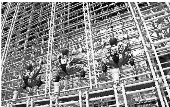
图为新型建筑防护施工机器人。

位于约旦河西岸的巴勒斯坦智库研究员哈尼·马斯里说，中止地方选举的决定“无疑加深了加沙地带和约旦河西岸之间长达10年的宿怨”。他认为，地方选举被中止肯定会对未来可能举行的立法委员会选举和总统大选造成不利影响，在加剧巴内部分裂的同时，也损害了巴勒斯坦独立建国的目标。(新华社电)