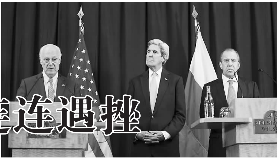
图为美国国务卿克里(中)、俄罗斯外长拉夫罗夫(右)和联合国秘书长叙利亚问题特使德米斯图拉出席联合记者会。