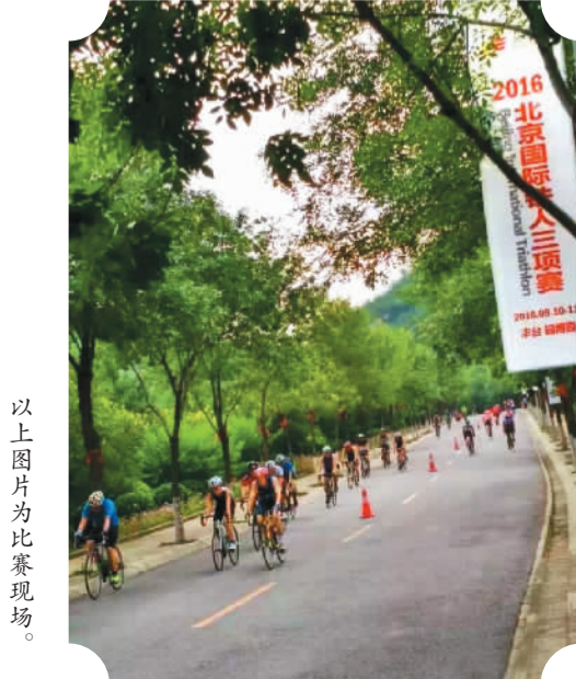
以上图片为比赛现场。