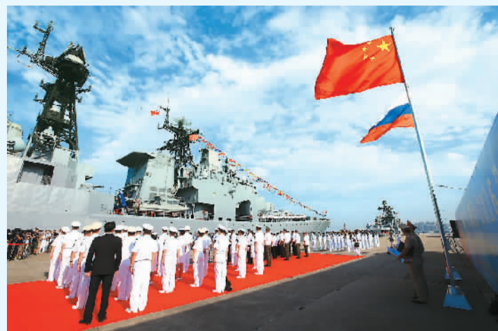
中俄“海上联合—2016”军事演习于9月12日—19日在广东湛江以东海域举行。图为12日，俄罗斯参演军舰驶抵湛江某军港，中国海军在码头举行欢迎仪式。

华东政法大学政治学研究院院长高奇琦介绍，未来《报告》有望用多语种发布，向国际社会传播成果。