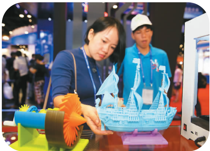
9月12日，在第十三届中国—东盟博览会上，许多企业借助博览会展示最新科技成果，拓展东盟国家市场。图为观众在博览会上了解3D打印产品。