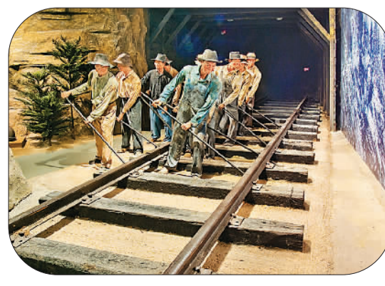
博物馆内“还原”历史场景

如今,在华侨华人博物馆的网上虚拟体验页面中,网友可自主选择“华哥”“侨妹”两位萌娃担任导游。只需通过键盘敲击,观赏者就可以前后左右控制游览路径,进入分馆参观,鉴赏馆藏文物。