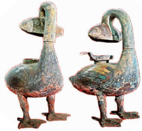
海昏侯墓出土的青铜雁鱼灯