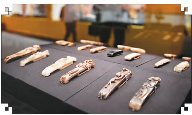
441件海昏侯墓出土文物在首都博物馆展出

除了主墓外,其东侧同茔异穴的海昏侯夫人墓(已被盗)尚未挖掘,目前地势最高。田庄带我们走上墓顶部,整个墓园一览无余。园内共有墓葬9处,东门内分布着5处,北门内2处。每座附葬墓前均有小型祠堂的遗迹。墓园内还发现多口水井,这说明当年是有守墓人的。主墓西侧的车马坑,呈南北细长形。从这里出土的文物已被广为介绍,但身临其境看到这个聚集了那么多珍贵文物的地点,仍然感受到一种震撼。田庄说,主墓正北的一座墓原认为是他的妃子墓,然而棺内腰部发现有佩刀,疑为海昏侯一个儿子的墓。刘贺的牙齿保留完整,已送往有关部门进行DNA检测,可以对比此墓主人可能留下的DNA。他这一说,我特意去看挖掘现场,虽然只有93平方米,但同样是整齐的三层发掘梯,考古操作很规范。