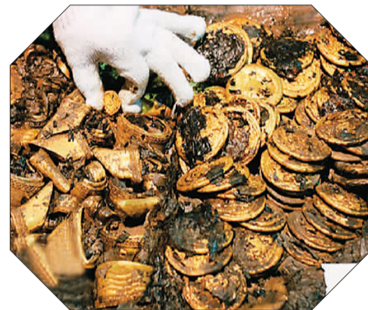
海昏侯墓出土的金饼