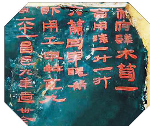
海昏侯墓出土的文物上有“昌邑”的字样