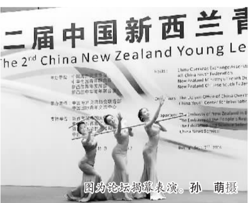
图为论坛揭幕表演。

本次论坛的主题为“创新创业·共筑梦想”。中国、新西兰青年代表围绕主题展开了热烈讨论。中新青年论坛是两国青年间重要交流活动，对促进中新友好交流、增进相互理解、深化互利合作、助力公共外交具有重要意义。