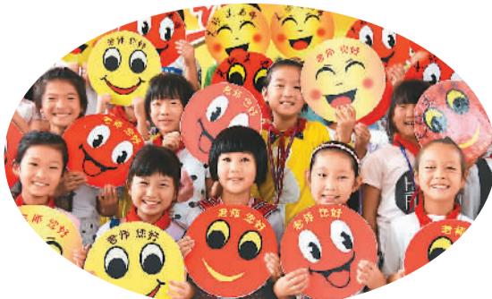
9月9日，山东省沂源县荆山路小学学生将“我的笑脸”送给老师。

有评论指出，关爱教师不应只在教师节，而是要养成尊师重教的习惯。教育部日前发文指出，各地各校要进一步完善利教惠师政策，努力保障教师各项权益。