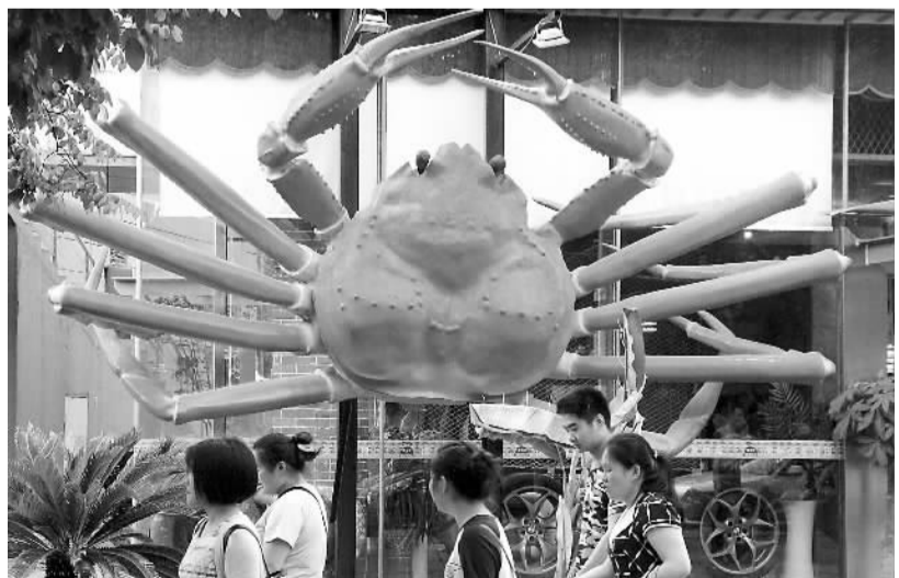
近日,一只巨大的仿真螃蟹雕塑亮相江苏苏州街头,为秋季螃蟹上市营造气氛,吸引了许多路人的目光。图为行人从苏州津梁街上的巨型螃蟹雕塑旁经过。