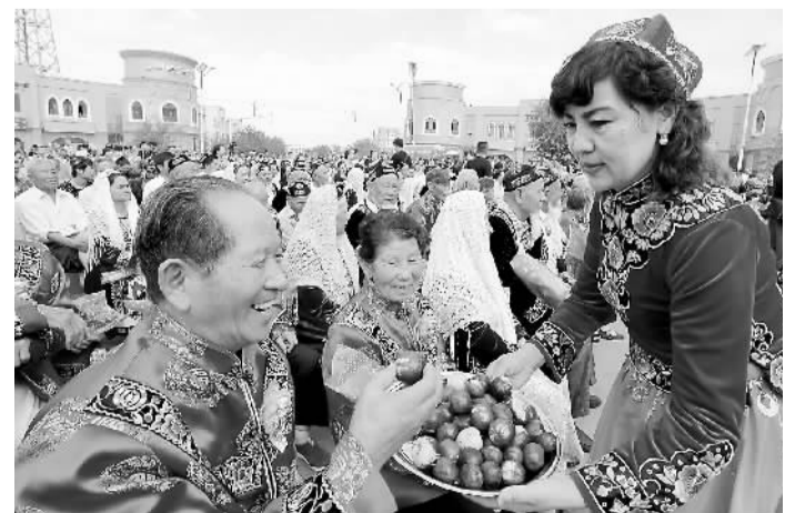
日前,2016哈密“甜蜜之旅”大枣节在新疆哈密市开幕,吸引了众多客商前来洽谈订购。图为客商品尝新鲜大枣。

据新华社大连9月9日电(记者高敬)国家知识产权局局长申长雨9日说,我国正在积极谋划实施专利质量提升工程,从多个环节着手促进专利质量提升,为专利交易转化奠定基础。我国发明专利申请量已经连续5年位居世界首位,国内有效发明专利拥有量超过100万件,已经成为专利“大国”。但我国的专利质量不高,市场转化率低,难以发挥助推经济创新发展和转型升级的作用。作为目前我国唯一的国家级、国际化专利技术品牌展会,中国国际专利技术与产品交易会自2002年创办以来,已经成功举办了9届,共有上万家厂商、8.2万余件专利参展交易。本届交易会设11个展区,除国内的大学、科研机构、企业外,俄罗斯、美国等24个国家和地区参展,5500多个项目进行展览展示。