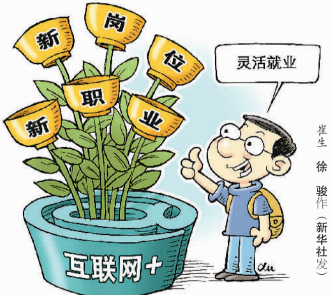
崔生 徐骏作 (新华社发)