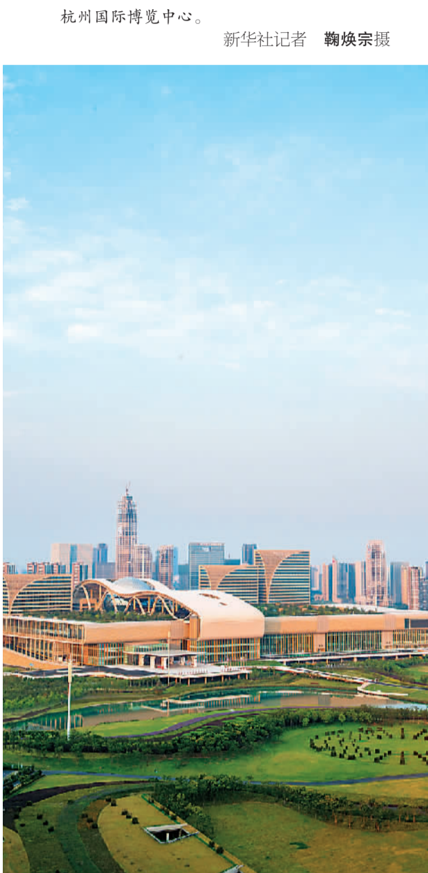
杭州国际博览中心。