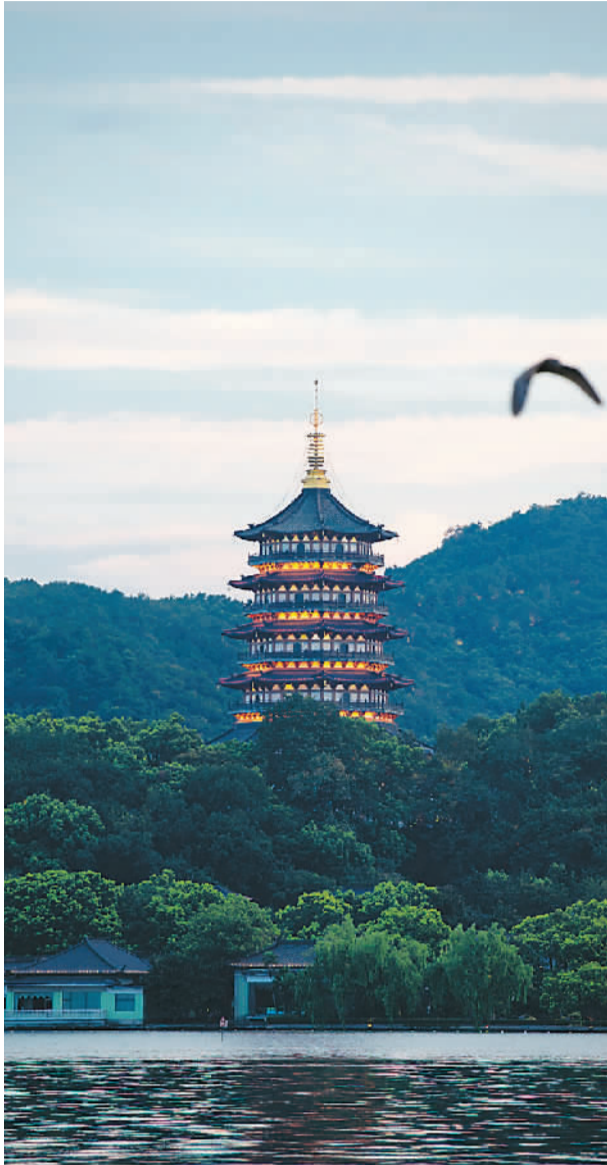
西湖湖畔的雷峰塔。