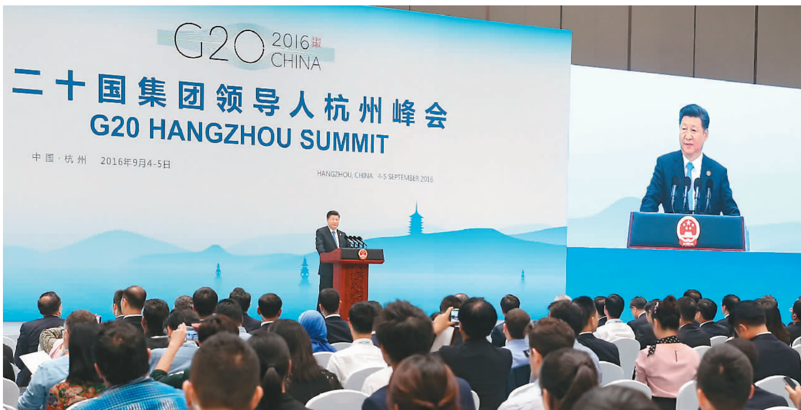
九月五日,二十国集团领导人第十一次峰会闭幕后,国家主席习近平在杭州国际博览中心会见中外记者。

据新华社杭州9月5日电 (记者臧晓程、屈凌燕) 5日,二十国集团领导人第十一次峰会闭幕后,国家主席习近平在杭州国际博览中心会见中外记者。 习近平介绍了在峰会闭幕会上总结的本次峰会达成的共识和取得的主要成果,即各方决心为世界经济指明方向,规划路径;决心创新增长方式,为世界经济注入新动力;决心完善全球经济金融治理,提高世界经济抗风险能力;决心重振国际贸易和投资这两大