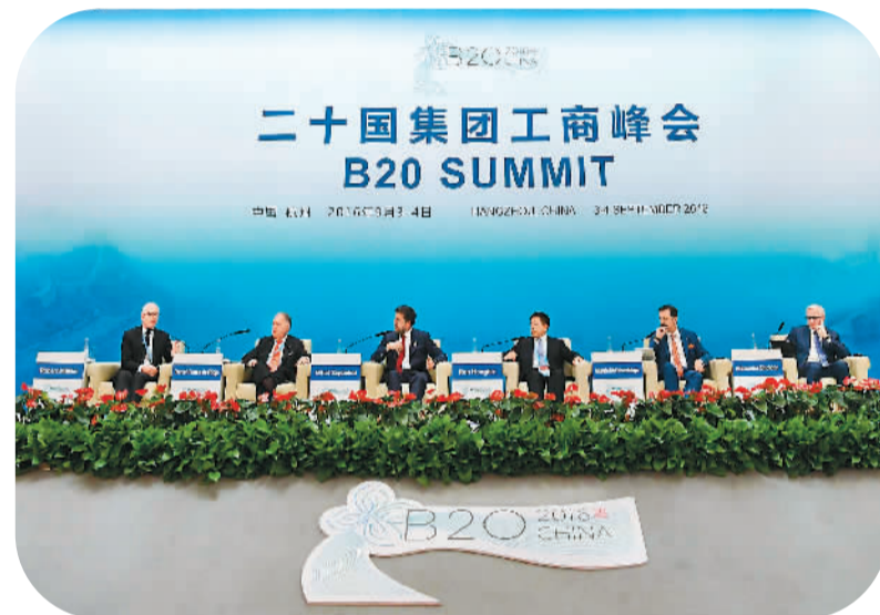
9月4日，嘉宾在B20峰会上发言。