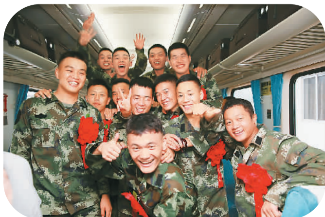
来自武警广西总队的2000余名退伍兵，日前踏上列车启程返乡，他们绝大多数是2014年夏季入伍的“95后”。图为河北籍退伍兵在车厢里合影。