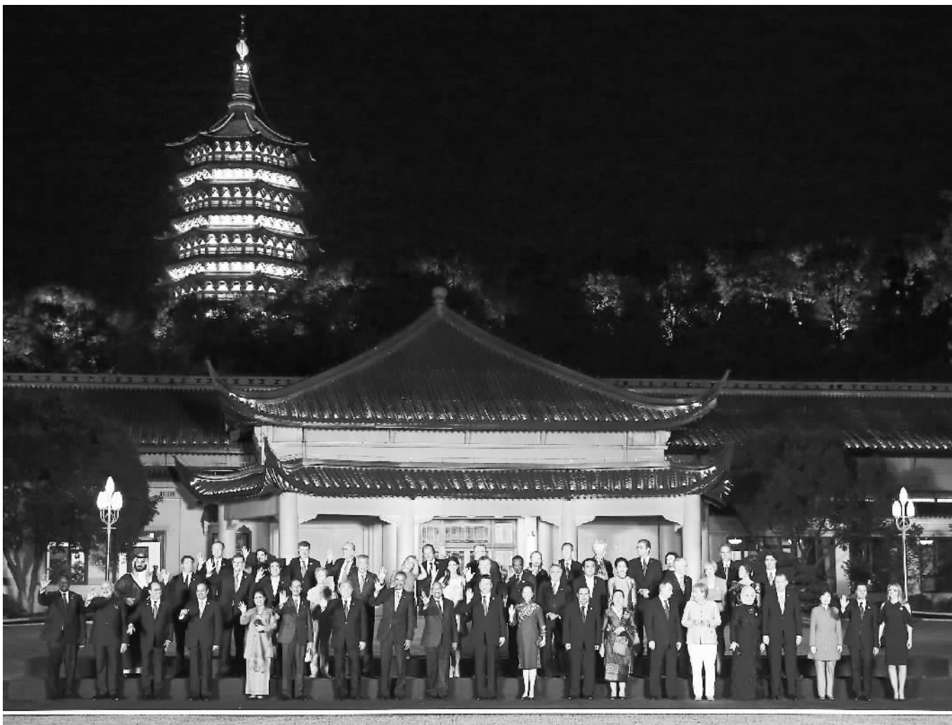
图为习近平和彭丽媛同外方代表团团长及配偶在室外草坪合影留念。

月色下的西湖，波光粼粼的湖水倒映着流光溢彩的夜灯。晚会在“春江花月夜”琵琶演奏中拉开帷幕，婉转抒情的乐曲为观众呈现出月照东山、花影摇曳的美好景象。民间小调“采茶舞曲”，展现出采茶女们源于生活又充满诗情的劳作之美。“美丽的爱情传说”讲述了梁山伯和祝英台、许仙和白娘子等中国民间爱情故事。“高山流水”以一曲古琴、中国鼓与大提琴的对话，传递中国与世界相知相近的美好寄望。“天鹅湖”呈现了美丽的白天鹅在西湖上翩翩起舞的美景。钢琴曲“月光”深情演绎印象派大师创造的明月之光。歌曲“我和我的祖国”抒写了全人类共通的情感。“难忘茉莉花”基于中国经典民歌，饱含对自然的热爱和对故乡风物的眷恋。晚会在交响乐“欢乐颂”中落幕。整套晚会借助灯光水影，亦真亦幻，精彩纷呈，高潮迭起，赢得阵阵掌声。