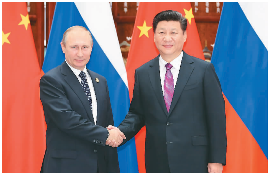
九月四日,国家主席习近平在杭州会见出席二十国集团领导人杭州峰会的俄罗斯总统普京。(详细报道见第三版)

9月4日,习近平主席在出席二十国集团领导人杭州峰会并致开幕辞时指出,二十国集团承载着世界各国期待,“应该让二十国集团成为行动队,而不是清谈馆。”