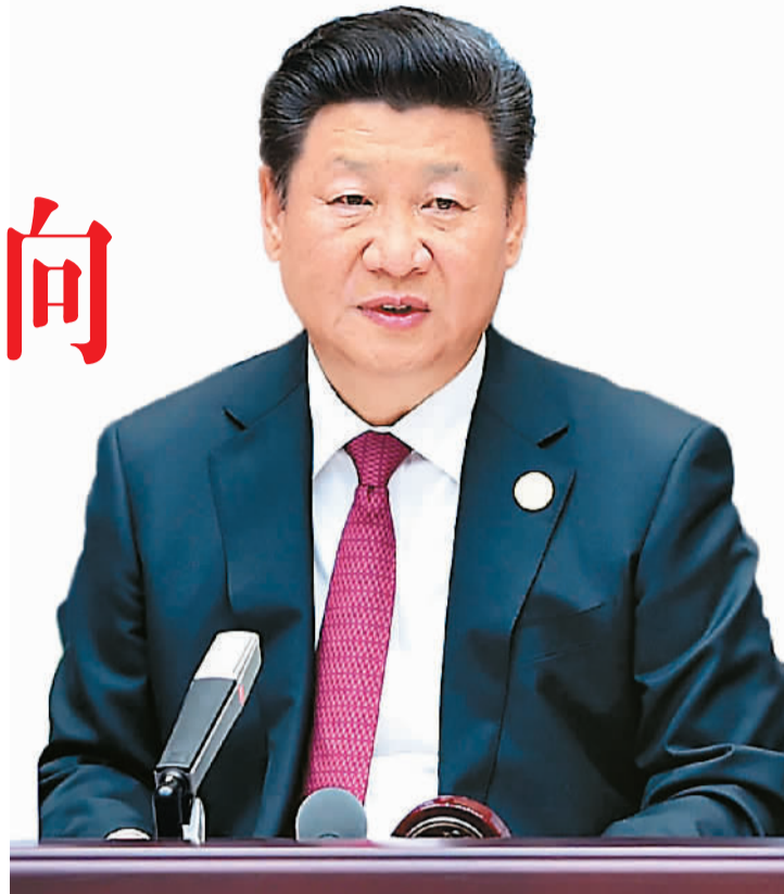
上图: 国家主席习近平主持会议并致开幕辞。