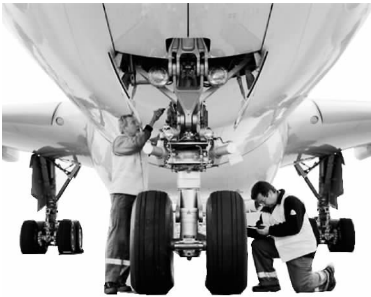
去年至今，海航对瑞士机场地面物流服务商Swissport、瑞士航空餐饮集团Gate Group以及瑞士航空MRO服务商——瑞航技术开展了并购活动。