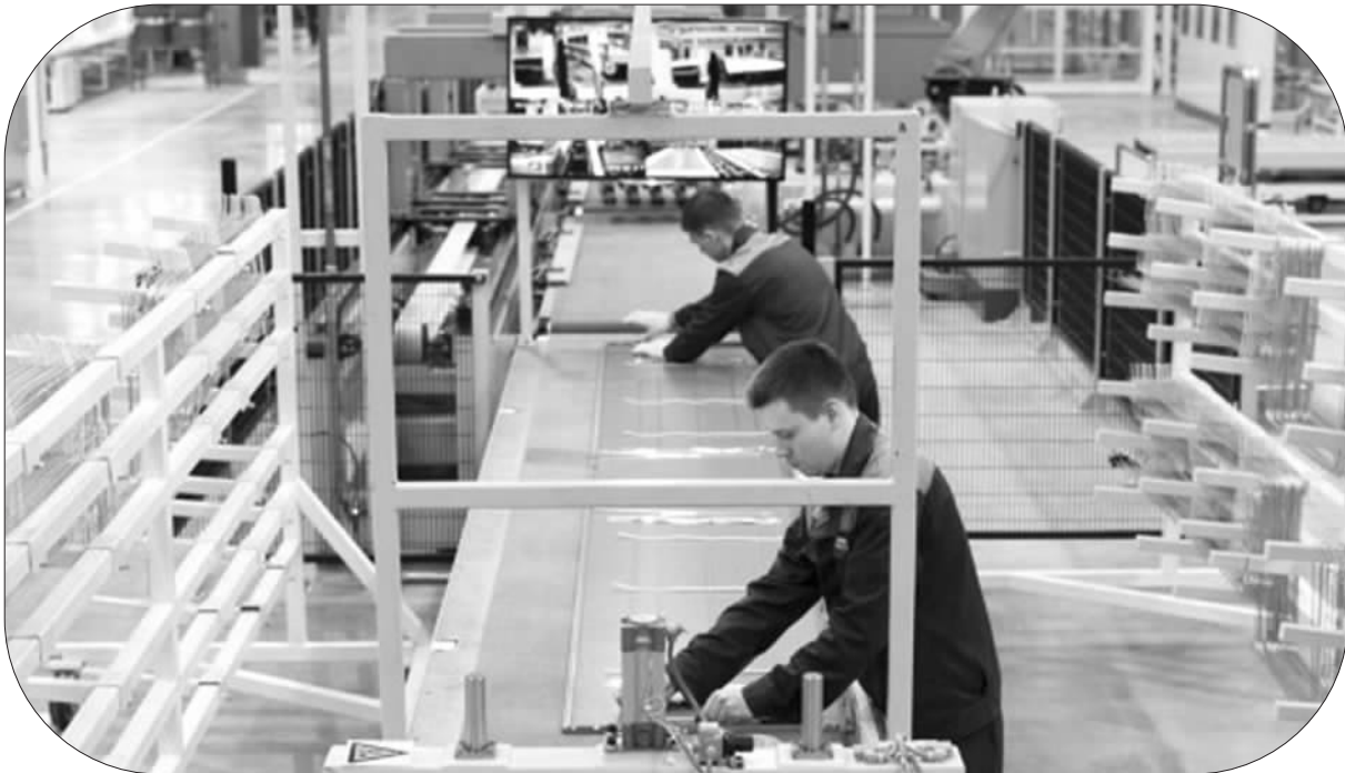
海尔今年在俄罗斯鞑靼斯坦共和国卡马河畔切尔尼的冰箱制造基地正式投产运营。图为在俄罗斯卡马河畔切尔尼市，工人进行内胆预装。

社科院世界经济与政治研究所国际投资研究室主任张明认为，近年来，中国企业境外并购的行业结构不断优化，“走出去”有望对国内经济转型升级发挥重要作用。