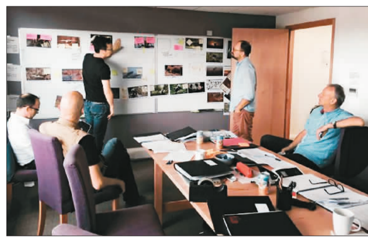
▲ 电影海报 ▲ 主创人员在讨论剧情