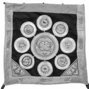
太阳花卉纹背扇—盖帕（广西三江侗族）

是实用品，也是呵护幼小生命的保护体，更是母亲与孩子紧密的连接。背扇工艺精湛、图案古朴、色彩斑斓、造型独特，不仅彰显了母爱的光辉和妇女们高超的技艺，也记录了先祖的故事和民族的历史，是西南少数民族文化艺术最集中的展示。