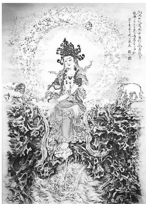
东方美神 赵玉芝作