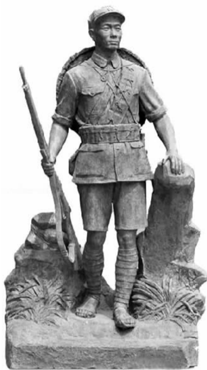
工农红军 刘开渠作