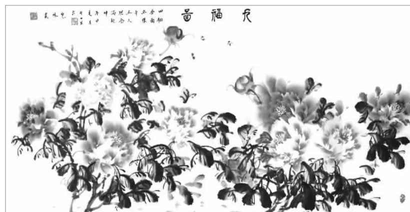
四个全面立根本 五大理念满乾坤 包林作 曹亚军书