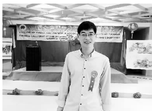
图为本文作者在菲律宾华人举办的美展现场留影