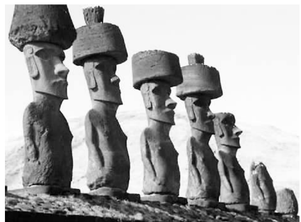
图为智利复活节岛上神秘的石人像

年在智利召开的APEC会议上,主人为与会各国领导人制作的民族服装“查曼多”,像盔甲一样,给人留下深刻印象。