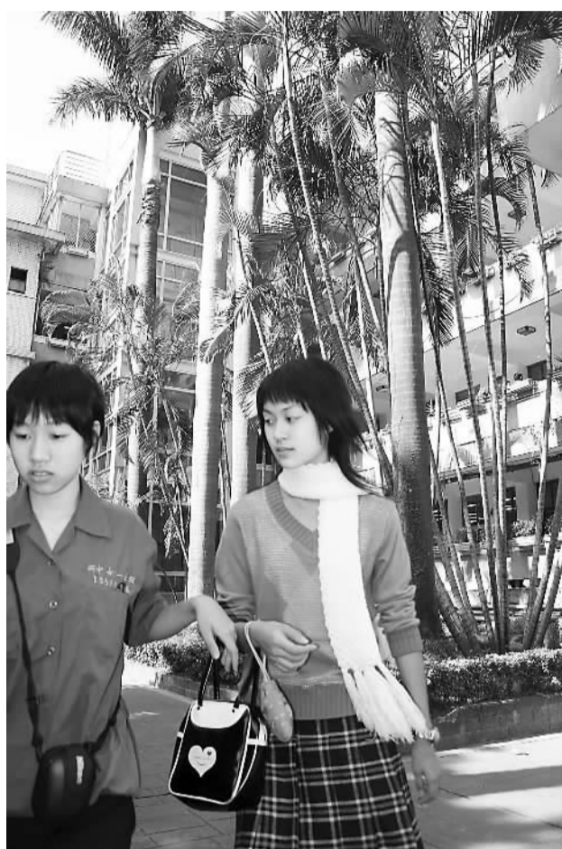
台北市第一女子高级中学(北一女)的学生在校园中。

当然，合也有合的理由。有人提出如果学生不了解异性，没学会两性相处，将来的人生和职场都会遇到障碍。是分是合，看来没有绝对的标准，还是要看办学效果。像建国中学这么强的中学，无论分校还是合校都会有人抢着上，同样，坚持不合的北一女也绝不愁嫁。