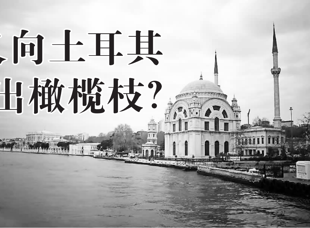
图为土耳其首都伊斯坦布尔。(资料图片)

在此前一次接受采访中,默克尔称德国与土耳其之间存在“特殊关系”,这不仅是因为在德国生活着300多万土耳其裔居民,还因为作为北约成员