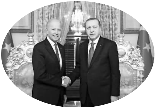
图为今年1月土耳其总统埃尔多安（右）和美国副总统拜登在伊斯坦布尔会面。

近来闹得沸沸扬扬的土美冷战似乎有了关系缓和的迹象。8月24日,美国副总统约瑟夫·拜登将到访土耳其。据悉,拜登此行意在向土方抛出橄榄枝,试图修复因此前土未遂政变受影响的两国关系。不只是美国,德国总理默克尔日前也频频向土耳其释放和解信号。安抚示好,西方对土耳其态度转变的背后,打的是什么算盘？