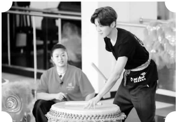
鹿晗（右）在学习舞狮

由浙江卫视和爱奇艺联合打造的校园体验节目《我去上学啦》第二季正在热播。这档以“青春、知识、正能量”为核心特点的节目，获得了较好的收视效果和口碑。同时，节目所展示的当代中国教育现状和中国年轻人的精神风貌，也引发社会热议。