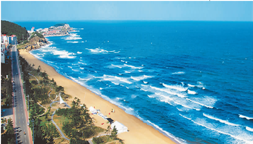
山东威海国家级海洋生态示范区

海洋自然保护区是指以海洋自然环境和资源保护为目的，依法把包括保护对象在内的一定面积的海岸、河口、岛屿、湿地或海域划分出来，进行特殊保护和管理的区域。任何单位和个人都有保护海洋自然保护区的义务与制止、检举破坏或侵占海洋自然保护区行为的权利。