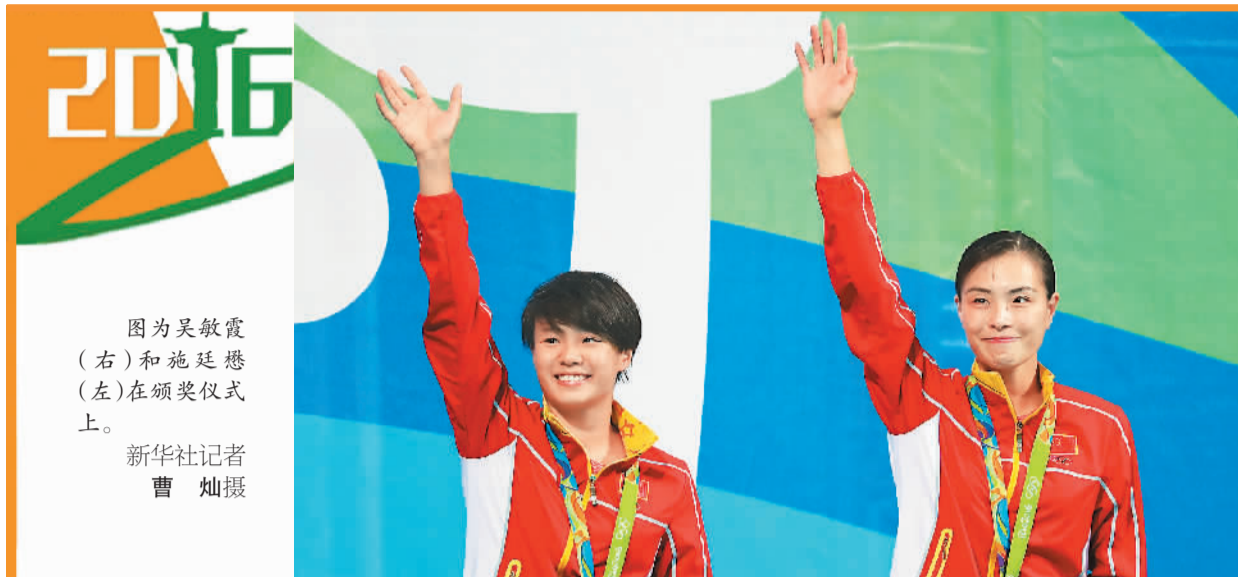
图为吴敏霞(右)和施廷懋(左)在颁奖仪式上。