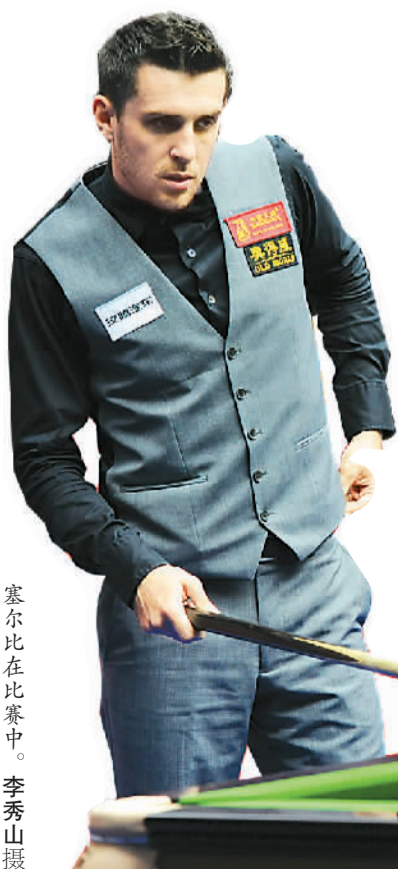
塞尔比在比赛中。

7月27日下午, 目前排名世界第一、两届斯诺克世锦赛冠军马克·塞尔比惨遭泰国“黑马”塔猜亚横扫, 止步正在江西上饶市玉山县进行的“汉腾汽车”2016斯诺克世界公开赛第二轮, 爆出最大冷门。在接受笔者专访时, 塞尔比聊了很多自己的成长经历以及来中国参赛的感受。