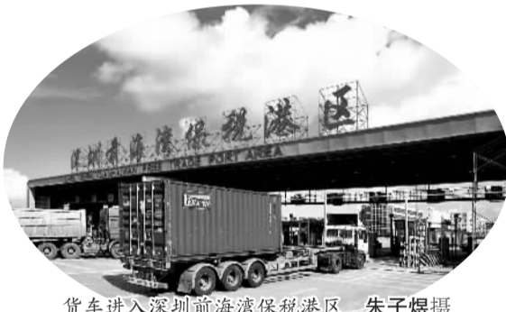
货车进入深圳前海湾保税港区

创新相结合,形成一套适应国际国内要素有序自由流动的管理体制和监管模式。业内人士评价说,备案制改革符合自贸区建设的要旨,体现了外资投资管理与国际接轨的趋势,更方便外资企业进入自贸区。