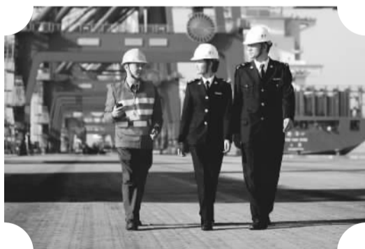
广州海关助力自贸区贸易便利化水平全面提升

此次新规另一大重要内容是大幅放开外商经营许可,调整外商投资产业指导目录部分内容,确认四大自贸试验区