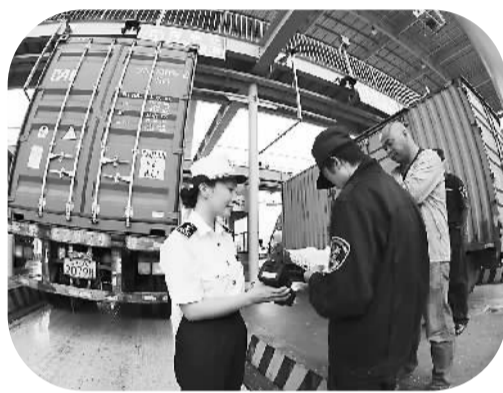
上海自贸区海关关员了解智能化卡口运作情况。

在放宽投资准入方面,自由贸易区战略提出:“大力推进投资市场开放和外资管理体制,进一步优化外商投资环境。”已先行先试的改革创新制度包括,与放宽市场准入相联系的先照后证、三证合一、企业准入单一窗口、证照分离改革等现代商事登记制度及市场准入负面清单制度试点等。