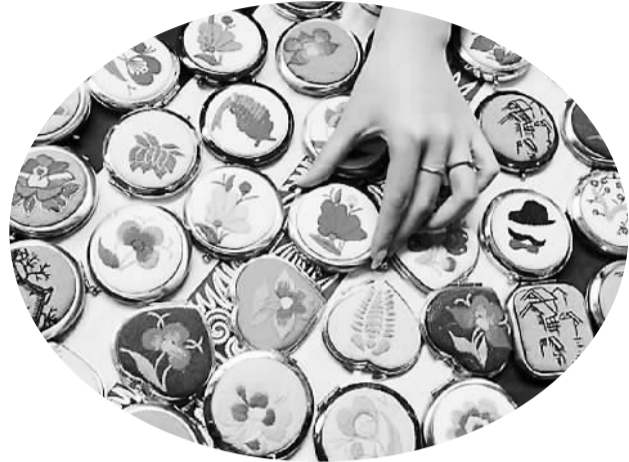
用刺绣做封面的镜子很惊艳（资料照片）

与此同时，文博会各具亮点的其他系列活动也在紧锣密鼓地开展中，届时将为广大民众带来一场瞩目的文产盛宴。其中，2016第三届中国国际（云南）文化旅游投资洽谈会将隆重推出30个“中国好项目”。除在200余个云南省优质资源中，优选20个云南最具投资价值项目外，还面向全国