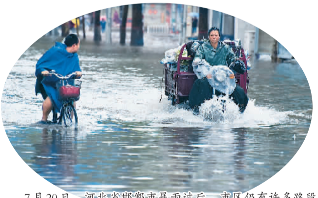
7月20日，河北省邯郸市暴雨过后，市区仍有许多路段积水严重。

新闻、新京报等媒体，都及时在新媒体上发布了辟谣文章，指出哪些照片是张冠李戴、哪些是伪造的。像“北京地铁公主坟站被淹”这一照片，被北京地铁公司官方微博认证为不实图片。有心细网友发现，该照片是由此前武汉地铁被淹时的图片处理而成。另一条在朋友圈被热传的信息“公共自行车车桩被淹的区域，请不要靠近！可能漏电！已有人被击！”也被北京市交管局认定为谣言。据北京市交