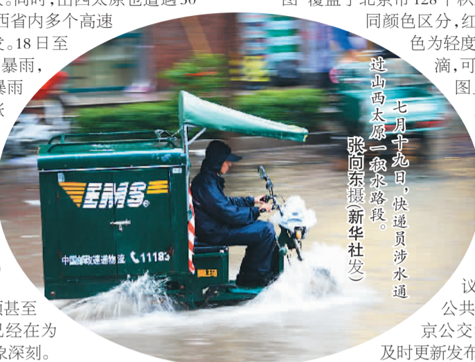
七月非夏日，快递员涉水通途。

而令更多网民点赞的，是今年汛期，北京交管局首次运用“互联网+”制作了“积水地图”：一旦启动暴雨橙色及以上预警，将在手机导航地图里实时显示积水点信息。北京市民鲍方说：