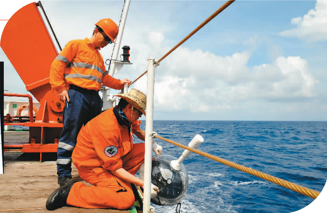
7月18日，“张謇”号上的科考队员在南海布放海洋气象漂流浮标。