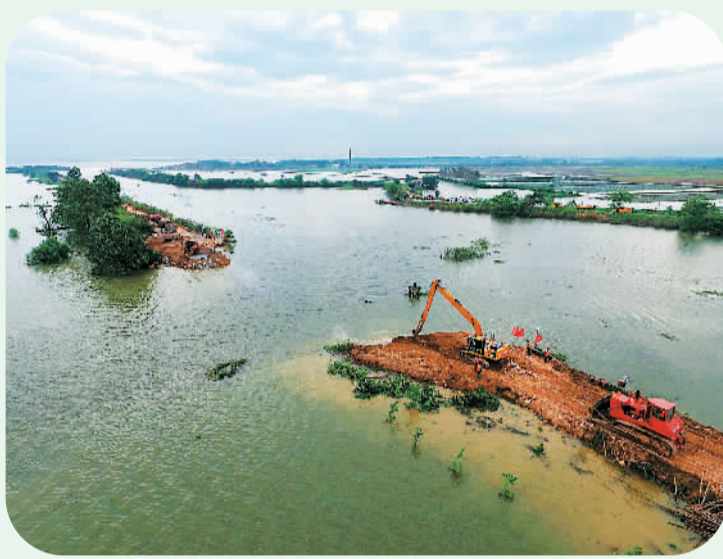
7月17日凌晨3时左右,湖北黄梅县濯港镇丁字街村考田河堤坝出现溃口,并不断扩大。目前,武警水电部队官兵正逐步开展溃口封堵工作,预计5天左右完成。此次溃口已导致1.5万亩农田、精养鱼池淹没,9个村(场)16881人受灾,5666名受灾群众被集中转移安置。图为7月18日,抢险人员在封堵溃口。