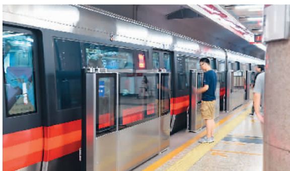
7月18日凌晨,在北京地铁永安里车站,我国最早的地铁线路——北京地铁1号线成功立起第一扇屏蔽门。预计到2017年底,全线所有车站的屏蔽门将安装完工。